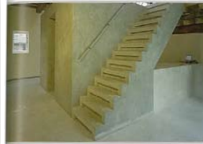
Beton bespoot de sferen van de benedenverdieping. Het blok met alle voorzieningen is niet van prefab beton, omdat het te moeilijk te maken was. Het is daarom gemiddeld metselwerk besmeerd met cementgebonden specie. Balie en traptreden zijn wel van prefab beton.

Het eigentijdse projectbureau bestaat uit een betonnen blok in een schuur met hieromheen veel open ruimte, doorzichtige kantoren en een open zolder met werkplekken. De nieuwe kantoorfunctie past goed in de uit 1893 daterende Brabantse langgevelboerderij. Dit komt mede doordat het ontwerp is afgestemd op het traditionele gebouw en doordat zo veel mogelijk oorspronkelijke materialen zijn gebruikt.