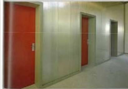
Doorzichtige lexan-kunststofplaten voorkwamen dat de hoge, smalle kantoren benauwend werden. De ondoorzichtige tussenwanden zijn bewust teruggeplaatst en met dezelfde platen verbonden aan de voorwand, zodat deze niet wordt verdeeld in drie aparte vakken.