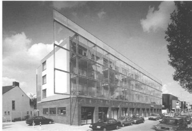
ARCHITECTUURPRIJS gemeente Eindhoven '97